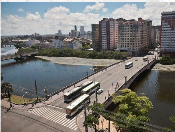
Figura 06 – Ponte Duarte Coelho

Em 1789, através de muitos aterros, iniciou-se uma série de transformações na localidade, sendo criada a Freguesia do Santíssimo Sacramento do Santo Antônio. O bairro de Santo Antônio abriga a Capela Dourada, fundada no século XVIII; o Museu Franciscano de Arte Sacra; o Convento Franciscano de Santo Antônio; a Igreja de São Pedro dos Clérigos, fundada no princípio do século XVIII; a Igreja de Nossa Senhora da Conceição dos Militares; o Liceu de Artes e Ofícios; a Secretaria da Fazenda; o Arquivo Público Estadual; a Praça Joaquim Nabuco; o Gabinete Português de Leitura, fundado em 1850; a Ponte Duarte Coelho (Figura 06) e a Ponte Santa Isabel (Figura 07).