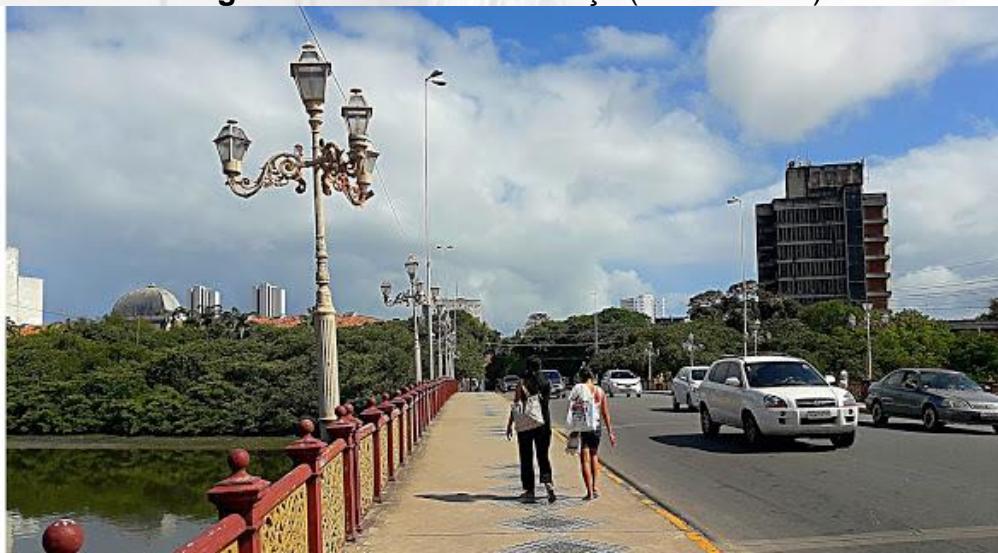
Figura 05 – Ponte 6 de Março (Ponte Velha)

“O conde Maurício de Nassau residiu na Ilha, sendo este o local onde iniciou a sua expansão territorial. Nassau fundou uma pequena cidade, abrangendo toda a área e, em 1643, construiu o Palácio da Boa Vista, ou Schoonzit, onde atualmente se encontra o Convento do Carmo do Recife. Em 1644, Nassau construiu uma ponte em madeira, denominada Mauritstaad, para facilitar o acesso ao Palácio e ao Porto do Recife, a Ponte atualmente é nomeada oficialmente como Ponte 6 de Março, popularmente conhecida como Ponte Velha, como visto na figura 05.