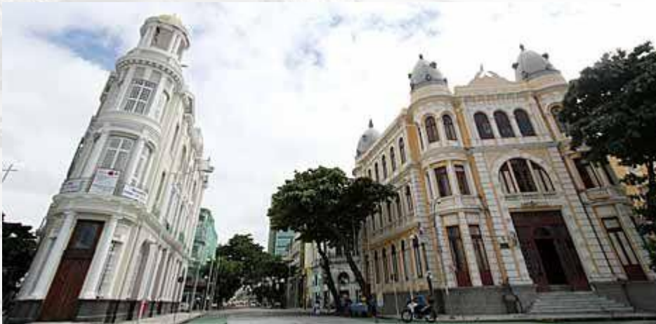
Figura 03 – Convergências das ruas ao porto