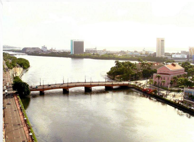
Figura 07 – Ponte Santa Isabel