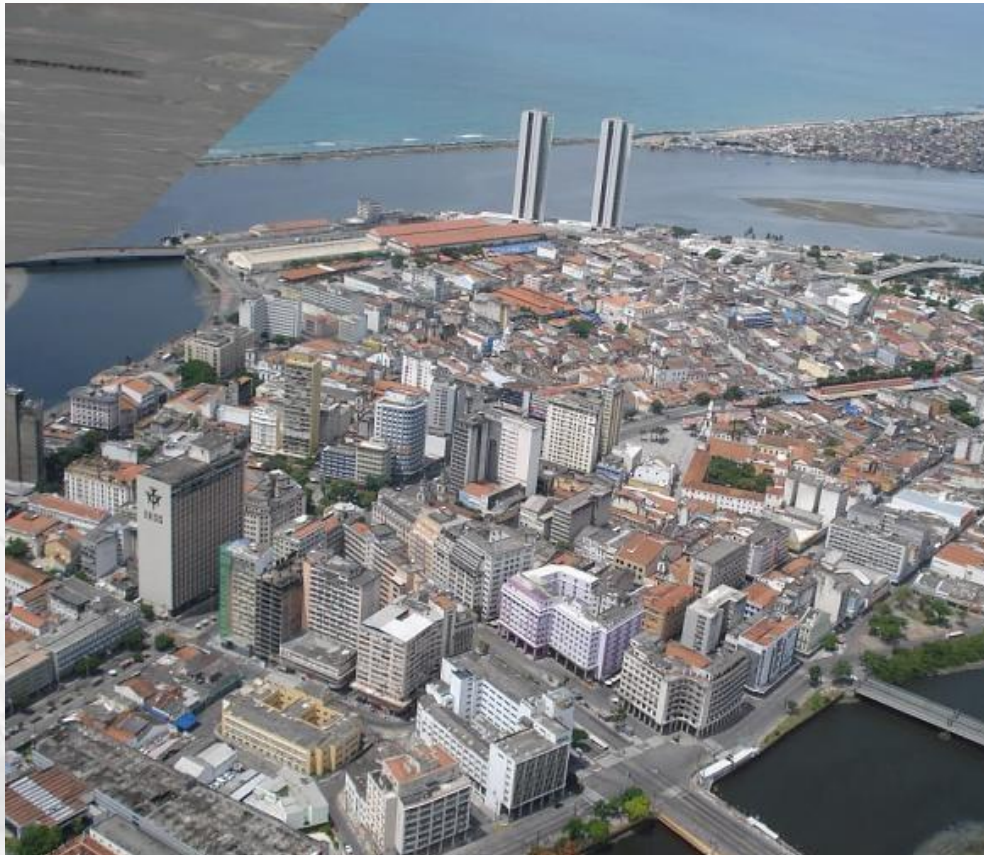
Figura 08 – Vista panorâmica da área central e urbana de São José