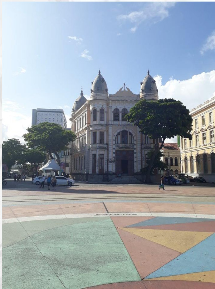
Figura 04 – Marco zero e Associação Comercial de Pernambuco

do Recife pode ser compreendida por sua identidade multifuncional, arquitetônica, ponto de convergência da sociedade recifense e de lazer que se expressam em sua potencialidade comercial, habitacional e pelo estilo eclético de sua arquitetura, no qual se pode constatar, exemplares como o Museu do Estado (esquina da Rui Barbosa com a rua Amélia), em que seu ecletismo está posto nos arcos góticos, no balcão românico, no torreão da fachada central, que lembra os castelos medievais (JORNAL DO COMERCIO, 2015). E outros como a Estação Central, o Gabinete Português de Leitura e o diário de Pernambuco. Há também o Museu Militar, sediado no Forte do Brum (1629), originalmente Forte do Bom Jesus.