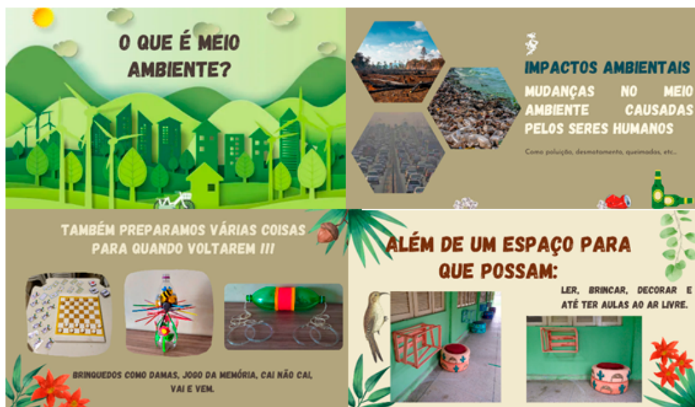
Figura 1 - Slides utilizados durante as etapas.

O primeiro momento, foi realizado pelo aplicativo Google Meet, constituindo-se de uma apresentação na plataforma Canva, em que cada slide (Figura 1) foi construído com elementos textuais e visuais, para instigar a iniciação de debates, onde a sequência de temas foi sistematicamente montada com o objetivo de ter um melhor desenvolvimento cognitivo e assimilativo entre os temas. A apresentação foi dividida então em 3 etapas: