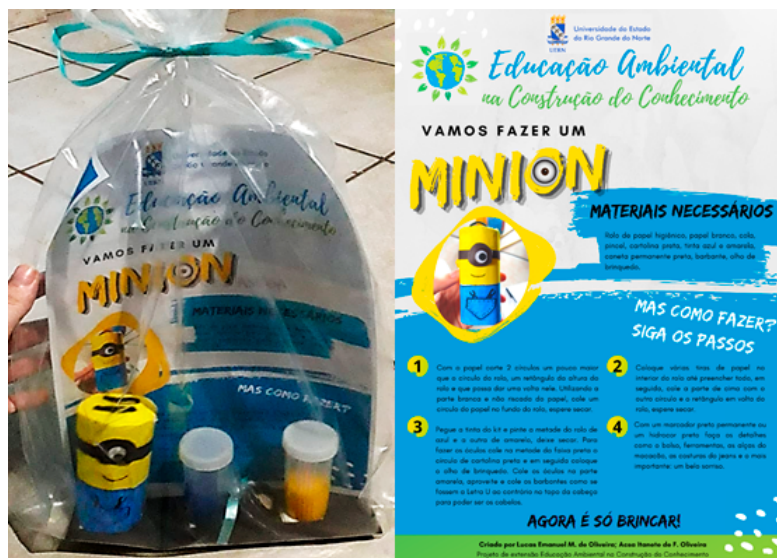
Figura 3 - Kits e cartazes produzidos para distribuição para os alunos.