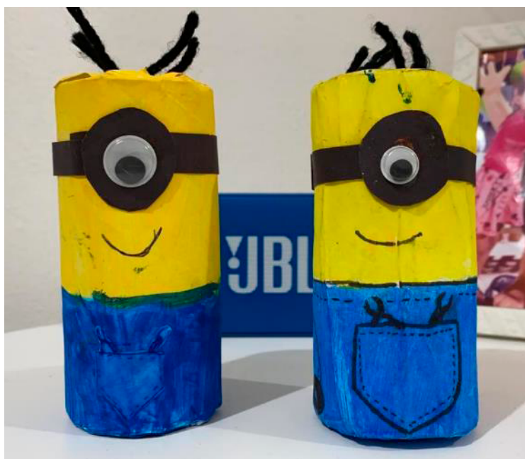
Figura 6 - Comparação do Minion produzido por um aluno (esquerda) e o distribuído no kit (direita).