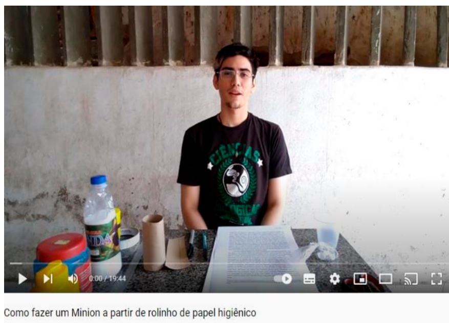
Figura 2 - Vídeo da oficina disponível no YouTube.

Para o segundo momento, ocorreu a oficina de produção de Minions usando rolo de papel higiênico, que aconteceu assincronicamente por meio de um vídeo explicativo que foi produzido e disponibilizado no Youtube intitulado "Como fazer um Minion a partir de rolinho de papel higiênico" (Figura 2). Para cada um dos alunos foi cedido um kit (Figura 3) que continha sachês com tintas azul e amarela; um olho de brinquedo; um pedaço de barbante preto e um pedaço de cartolina preta, além de um cartaz impresso, em folha A4 reutilizada, com as instruções de confecção e um boneco Minion já feito pelos integrantes do projeto para os alunos da escola terem como referência e desta forma facilitar a confecção. A distribuição desses kits ocorreu na escola em conjunto com a entrega de cestas de alimento para as famílias, que foram produzidas pela escola municipal com os recursos que seriam destinados à merenda escolar.