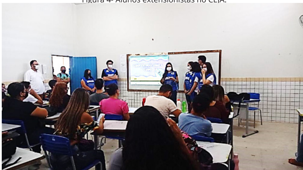
Figura 4- Alunos extensionistas no CEJA.

los participantes e a informalidade e dinâmica sempre chamam atenção da população, na maioria das vezes, os participantes modificam seus conceitos sobre a vacinação e aproveita para atualizar seus esquemas vacinais, pois muitas vezes estão com os imunobiológicos atrasados, necessitando de reforço ou iniciar um novo plano vacinal no momento das ações.