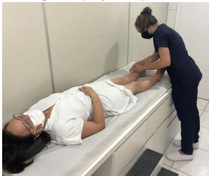
Figura 02 - Aplicação da acupuntura.