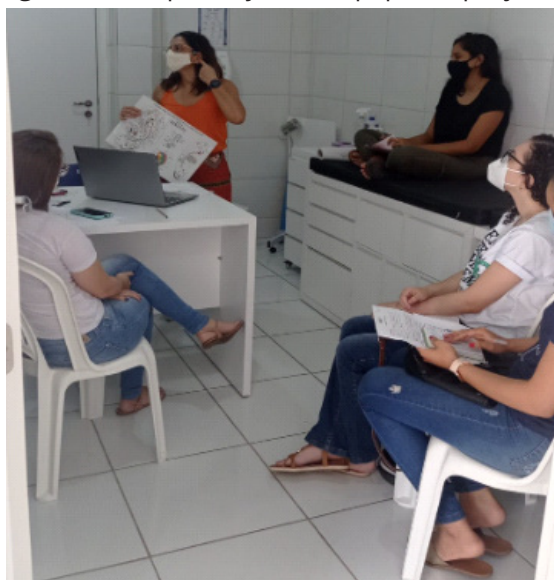
Figura 01 - Capacitação da equipe do projeto.

O projeto, então, foi dividido em dois momentos: 01 - aplicação da acupuntura; 02 - aplicação da auriculoterapia. A primeira etapa de cada um desses momentos era a capacitação de toda a equipe (professoras, técnicas e alunas extensionistas), através de reuniões, debates acerca das temáticas, retirada de dúvidas e prática das técnicas de intervenção supracitadas (FIGURA 01). Após esse momento, em cada uma das fases, as discentes entraram em contato com as possíveis participantes as convidando para as ações por meio de e-mails ou mensagens telefônicas.