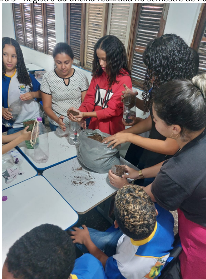
Figura 3 - Registro da oficina realizada no semestre de 2023.2.

A realização da culminância da UCE no semestre 2023.2 ocorreu na Escola Municipal Severino Bezerra, conforme descrito na metodologia deste trabalho. Esse momento foi de grandioso conhecimento e propiciou vivências significativas para os discentes da licenciatura em Geografia, tendo em vista a recepção, participação e engajamento dos alunos. No momento de execução da compostagem e do cultivo das hortaliças pode-se observar o empenho e admiração das crianças para com o assunto tratado, demonstrando assim a relevância da extensão e da educação ambiental na transformação social. A figura 03 exibe um dos registros da referida atividade.