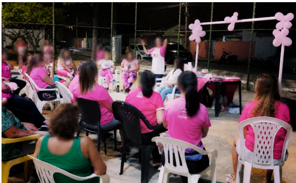
Figura 3: Ação educativa sobre câncer de mama no Outubro Rosa em praça comunitária.

A metodologia ativa, dialógica e integrativa concretizada no projeto, por meio de rodas de conversa, educação em saúde, desenvolvimento de materiais digitais, consultas de enfermagem e práticas integrativas e complementares em saúde, estimulou a autonomia dos acadêmicos, o estudo, a criatividade e a proatividade profissional na construção do cuidado. Tais experiências fortalecem a profissão da enfermagem e o compromisso ético e político com o SUS e com a promoção da saúde integral da mulher.