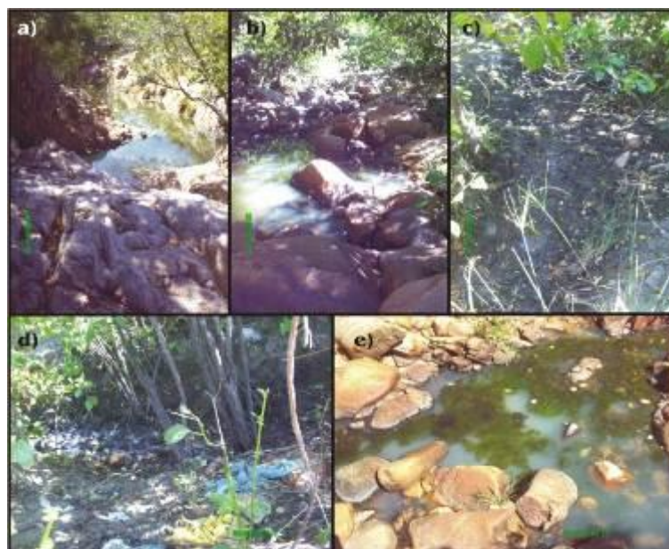
Figura 03: Tipos de rochas existente, resíduos sólidos e contaminação do leito do riacho.

Figuras a) e b) leito rochoso do Riacho Jatobá; c) Chorume proveniente do lixo em decomposição; d) resíduos sólidos presentes no trecho entre o lixão e o riacho; e) indícios de contaminação da água pelo chorume.