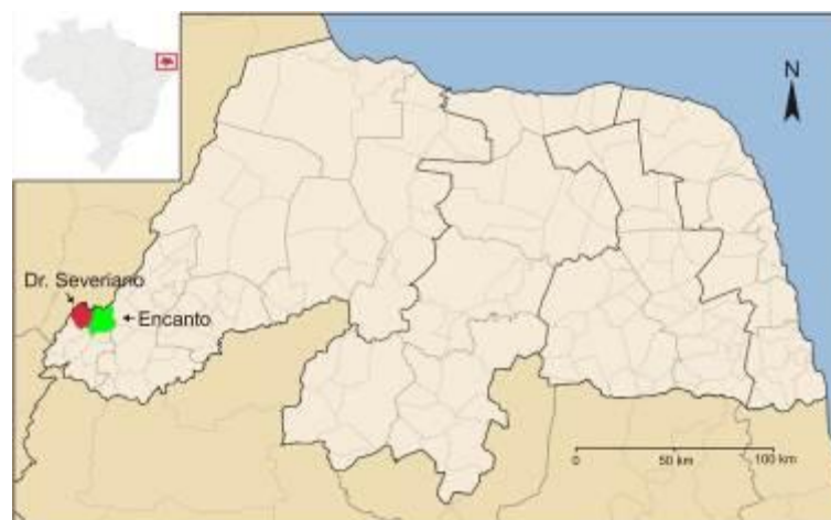
Figura 01: Localização dos municípios de Dr. Severiano e Encanto - RN