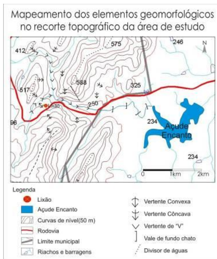
Figura 04: Mapeamento dos elementos geomorfológicos no recorte topográfico da área em estudo.