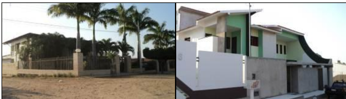
Figura 02: Aspecto das residências nos bairros Nações Unidas e Princesinha do Oeste

Como já assinalado anteriormente, nos bairros Nações Unidas e Princesinha do Oeste, onde as residências são de alvenaria, grande parte tem um elevado padrão arquitetônico, acessível somente àqueles que podem pagar ( figura 02 ). Nessas áreas da cidade podemos inferir que ocorre o que se pode chamar de auto-segregação, definida como uma prática de grupos da classe de mais alta renda que buscam um afastamento voluntário das áreas menos atrativas da cidade vistas como barulhentas, violentas e desagradáveis. Em contrapartida e ao mesmo tempo ocorreria nas outras áreas da cidade, como o Bairro Riacho do Meio e sobretudo no Conjunto Manoel Deodato, a segregação involuntária na qual as pessoas não escolhem onde vão morar, pelo contrário, são forçadas a isso por não terem condições de acesso a moradia de qualidade ou de pagar os altos aluguéis das áreas mais nobres da cidade, as camadas mais pobres são obrigadas a residirem em áreas mais pobres (SOUZA, 2008).