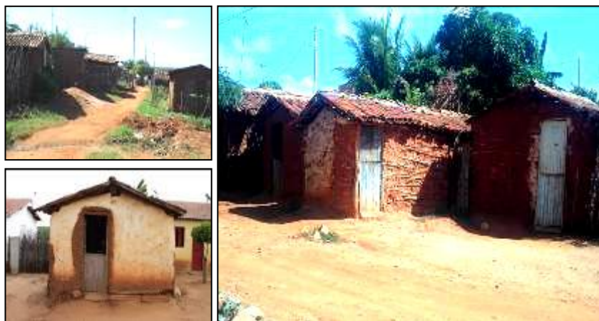
Figura 03: Aspecto das residências no Conjunto Manoel Deodato