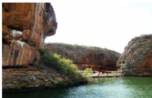
Fig. 5: Chegada ao lago do reservatório.

As visitas às cidades construídas para os desabrigados após a construção da barragem é de suma importância para o aluno refletir sobre as consequências desse processo. É necessário discutir a estrutura da cidade planejada, a forma como as pessoas vão ocupando o espaço, transformando-o e reconstruindo suas histórias em um novo lugar, assim como também conhecer a visão dessas pessoas sobre todo este processo.