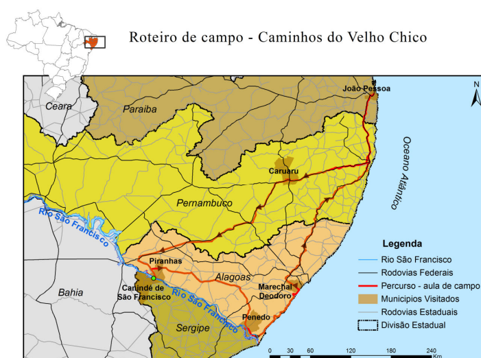
Fig.8: Mapa do itinerário da aula de campo. Elaborado por Pamela Stevens (2012)

O conjunto de temas/conteúdos apontados neste eixo revela uma gama de elementos presentes no nosso cotidiano e, que podem ser explorados em uma aula de campo. Nesse sentido, é importante destacar os modos de vida adotados na sociedade atual relacionando às novas necessidades de consumo e ao aprimoramento da tecnologia. Essa realidade é permeada por elementos inovadores, mas imprime tradições que passam a coexistir dialeticamente nessa sociedade.