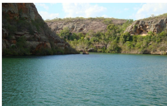
Fig.4: Percurso pelo reservatório de Xingó.

O lago profundo que se tornou este reservatório (fig. 5) devido ao represamento da água e construção da barragem, facilitou o processo de navegação nesta área. As belezas naturais oferecem condições e potencialidades turísticas à região. Esta é mais uma atividade desenvolvida em Xingó que trás fonte de renda e geração de empregos – de forma direta e indireta – para o local. É importante frisar que o reservatório, além da potencialidade turística e de fornecimento de energia, desenvolve projetos de irrigação e abastecimento de água para cidades e para a agricultura.