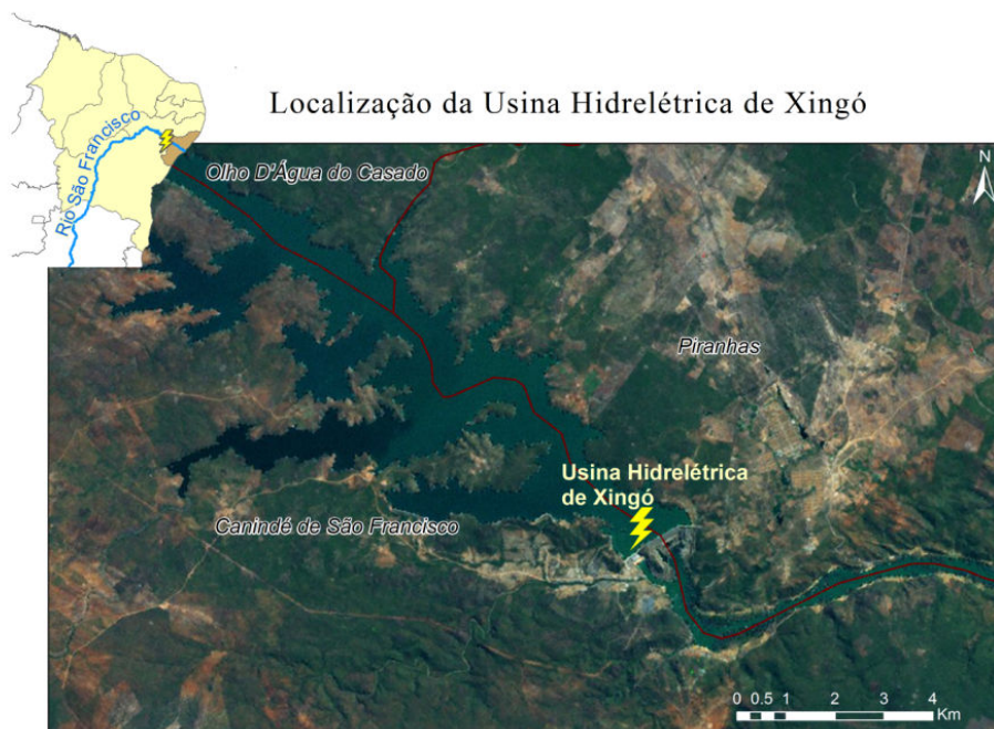
Fig.1: Imagem de satélite com a localização usina hidrelétrica de Xingó. Elaborado por Pamela Stevens (2012).

Tendo em vista este fim, a visita a uma hidrelétrica pode ser uma possibilidade de alunos e professores construir uma série de conceitos e estudarem conteúdos de diversas áreas do conhecimento. Nesse sentido, fizemos uma saída a Hidroelétrica de Xingó localizada entre os estados de Sergipe e Alagoas (fig. 1), no mês de dezembro de 2012.