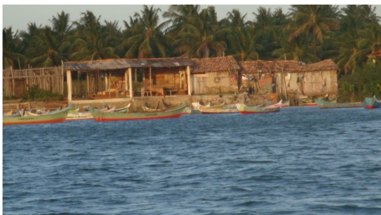
Fig.7: Casa de pescadores e agricultores as margem do rio São Francisco

Para finalizar a viagem de campo é fundamental uma visita à foz do rio São Francisco e entrevista com moradores da pequena cidade de Piaçabuçu (fig.7), poderá trazer inquietações e respostas a indagações elaboradas tanto na sala de aula, quanto nas conversas e entrevistas realizadas com os sujeitos sociais com os quais os alunos podem interagir. Aqui o foco do trabalho pode ser as consequências do represamento de água com a construção de barragens para hidrelétricas e o uso da água para projetos de agricultura irrigada. Em conversa com moradores, especialmente os agricultores, os barqueiros e os pescadores pode esclarecer parte das interrogações iniciais e colocar em xeque algumas falas sobre o tema central do trabalho. Antes do regresso à escola é importante que o grupo se reúna para avaliar a importância, os pontos fracos e fortes desta atividade.