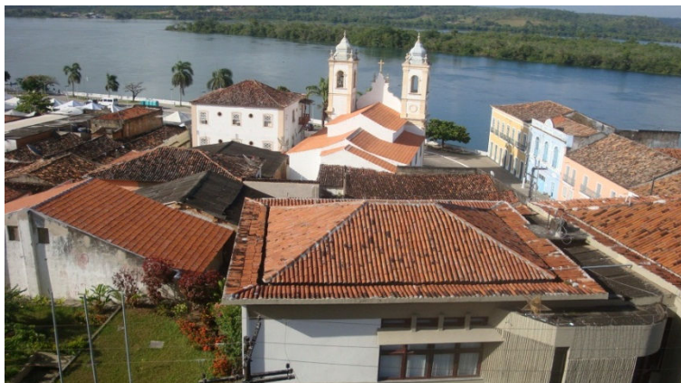
Fig.6: Penedo e suas construções do século XIX.

Encerradas as atividades previstas para esta parte da viagem, a ida a Penedo(fig.7) oferecerá ao aluno um acervo importante sobre a produção econômica dessa região e o papel das cidades neste processo. Observando a arquitetura, as instituições culturais, os armazéns à beira do porto, a suntuosidade das igrejas, as escolas, o teatro, entre outras construções podem indicar um período de apogeu econômico e cultura dessa cidade no século XIX.