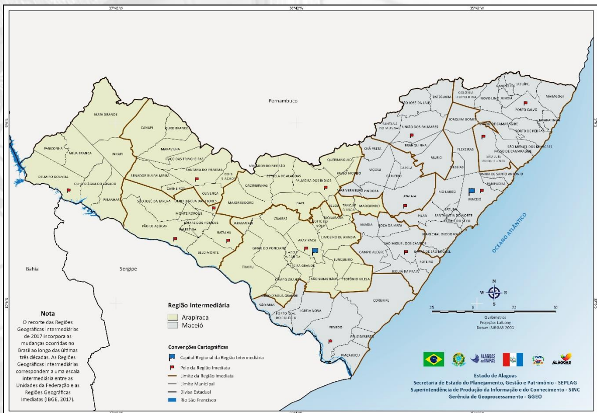
Figura 01 – Estado de Alagoas: Regiões Geográficas Imediatas e Intermediárias