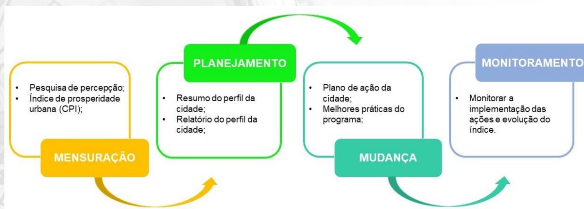
Figura 02 – Processo de aplicação do Índice de Prosperidade Urbana