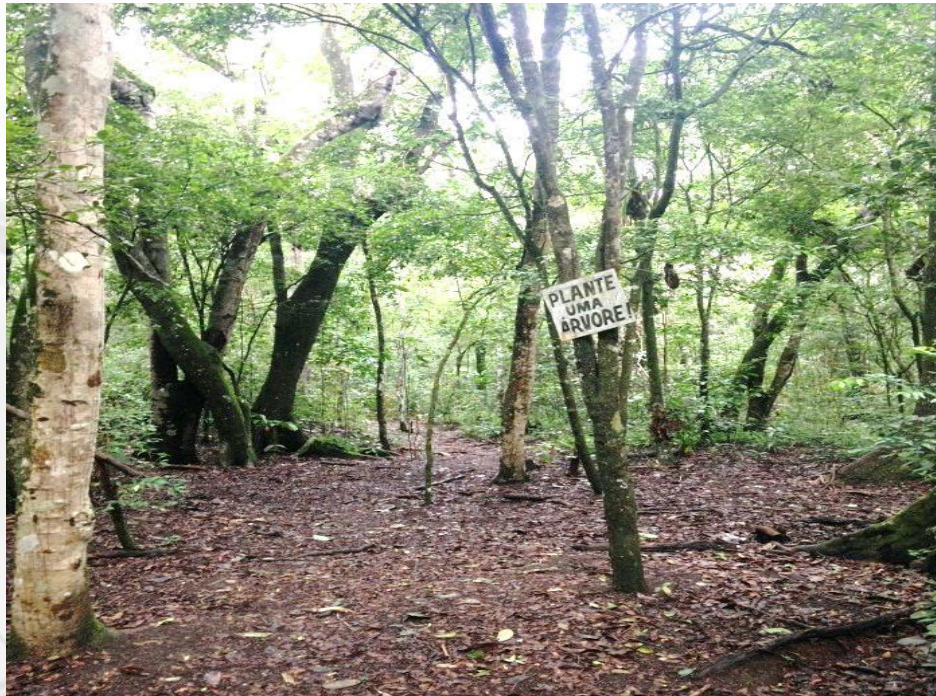
Figura 03 – Trilha no interior do Parque Estadual Mata do Pau-Ferro