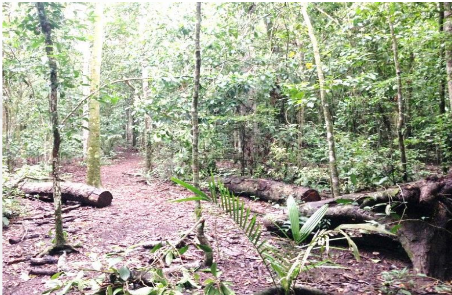
Figura 02 – Árvores cortadas no Parque Estadual Mata do Pau-Ferro