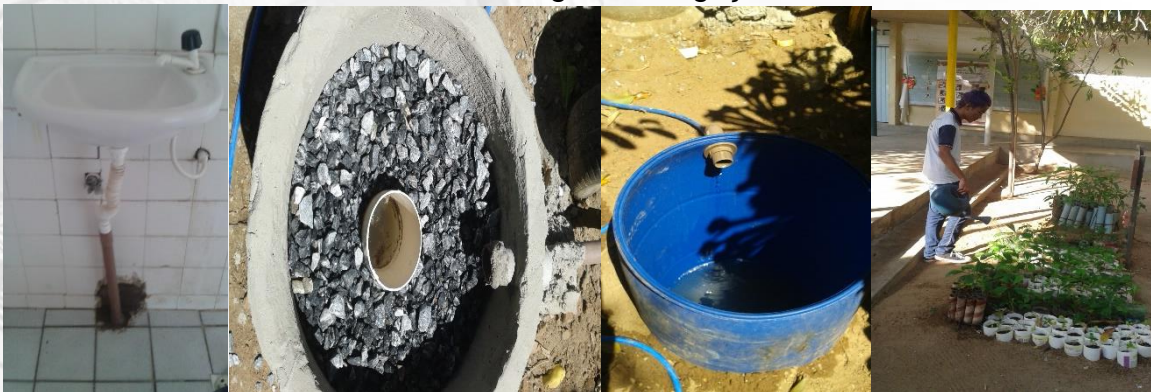
Figura 09 – Detalhe do sistema de coleta de água para reuso: respectivamente, coleta de água na pia de mãos; filtro para contenção de partículas; água filtrada coletada no tambor e aluno reutilizando a água na irrigação de mudas.

As árvores plantadas no entorno e no interior da escola EEPSC tem como foco o sombreamento e a produção de frutos. As frutíferas que carecem de irrigação para otimizar a produção de frutos ao longo do ano, diante da escassez de água na municipalidade, característico da ecologia do semiárido, desde o ano de 2012, vem sendo irrigadas com o rejeito de um sistema de dessalinização de água existente a cerca de 100 m da escola. Um total de 28 árvores são irrigadas. Para a irrigação do canteiro do PP o desperdício proveniente do bebedouro é recolhido e acondicionado em tambor para ser reutilizado. Em agosto de 2019, foi implantado um sistema de coleta de água proveniente das pias de mão dos banheiros masculino e feminino. Após passar por um filtro à água é acondicionada em um tambor. Aproximadamente 120 litros de água são coletados por dia e reutilizados na manutenção das mudas do PP (Figura 09).