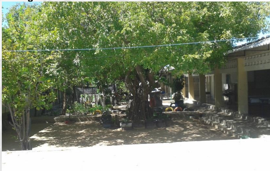
Figura 07 – Área verde situada no interior da EEPRSC

Outro resultado efetivo que faz parte da capilaridade do PP é a transformação da área de localização da escola e o entorno numa zona verde. São 134 plantas distribuídas em 31 espécies nativas e crioulas. Trapiá, aroeira, craibeira, paud’arco, juazeiro, xique-xique, mororó, oiticica, brauna, jucá, estão entre as espécies nativas registradas. Mangueira, groselha, romã, goiabeira, amora, acerola, cajado de são Jorge, mamoeiro, moringa, azeitona, none, cajarana, pitanga, tamarindo, ceriguela e limoeiro estão entre as plantas crioulas (Figura 07).