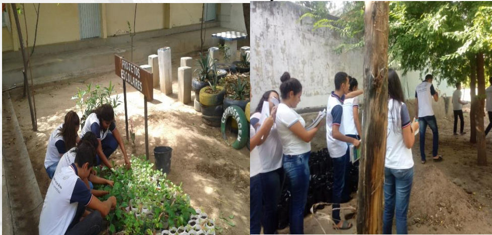
Figura 08 – Alunos da EEPRSC em aula de campo na área verde situada no entorno da instituição.

A área verde no entorno escolar, tem sido usada nas aulas de EA por professores da referida unidade de ensino e da Escola Municipal Raul de Medeiros Dantas (Figura 08). Portanto, envolvendo alunos do ensino fundamental e médio. Essa observação corrobora com a proposta de Silva (2018) de transformar espaços existentes na Escola, em um local agradável e acolhedor à comunidade escolar. Em colaboração com essas informações Gadotti (2009, p. 64) ressaltou que “Não aprendemos a amar a Terra apenas lendo livros sobre isso, nem livros de ecologia integral.”