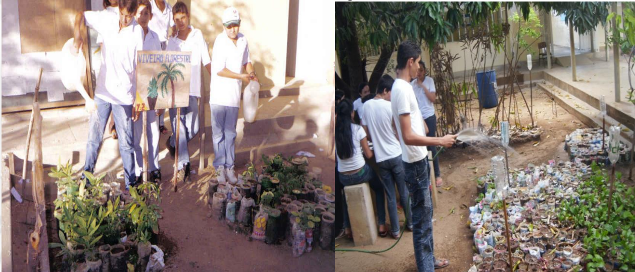
Figura 04 – Alunos que participaram do PP, respectivamente, na primeira e na segunda década desse século, regando as mudas

através da leitura espacial serão capazes de intervir de forma consciente e ativa na transformação de si e do mundo.”