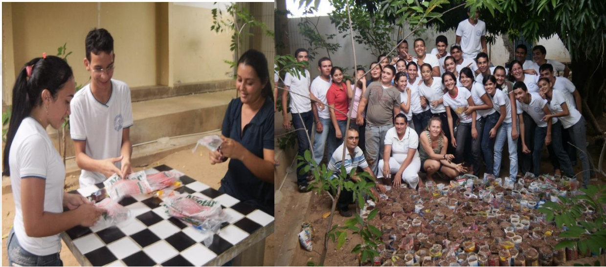
Figura 03 – Preparo das embalagens e depósito do substrato: areia, barro, esterco.