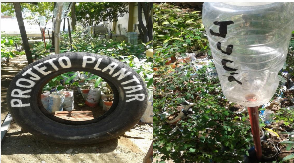
Figura 06 – Detalhe do PP com mudas de várias espécies

No canteiro anualmente implantado são produzidas cerca de 400 mudas, através de sementes e de estarcia 1 . A municipalidade possui pouco mais de 4000 habitantes. O número de alunos que tem a experiência do PP no currículo escolar em 21 anos de atividades é da ordem de 1800 nesse período 2 . São produzidas mudas de espécies nativas e de crioulas. Jurema branca, trapiá, craibeira, pereiro, catingueira, juazeiro, cumaru, marizeiro, pau d'arco, mororó, jucá, cumaru e aroeira se encontram entre as plantas nativas. Ceriguela, cajarana, goiaba, manga, pinha, moringa, pitomba, groselha, azeitona, se encontram entre as plantas crioulas (Figura 06).