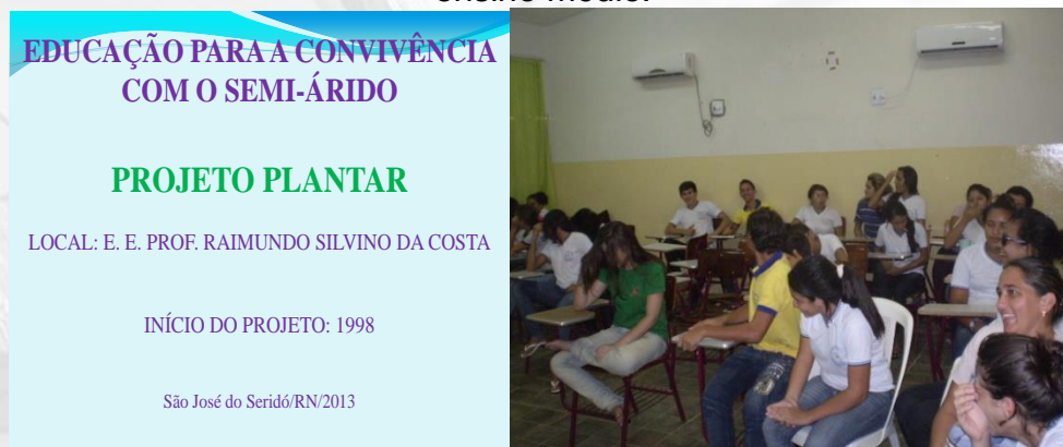
Figura 02 – Detalhe da apresentação do projeto plantar para os alunos do 2º ano do ensino médio.

As atividades desenvolvidas pelo PP, desde o início de 1998, iniciam-se com discussões que são estabelecidas em sala de aula referente as questões ambientais no plano global e o processo de desertificação no Nordeste brasileiro, onde se insere a municipalidade da pesquisa. No ensejo, também é realizada a apresentação do projeto, com enfoque dos aspectos metodológicos (Figura 02).