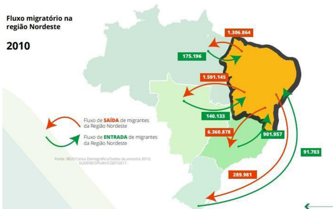
Imagem 02: Fluxo migratório da região Nordeste 2010.

Apesar de ser escrita nos anos 1970, a migração Nordeste-Sudeste ainda é alta no país, como mostra o gráfico abaixo, o número de pessoas que saíram do Nordeste segundo o Censo demográfico de 2010. Nesse interim pode-se afirmar que as coisas não mudaram e que a região Sudeste ainda tem o poder de atração aos moradores da região Nordeste, que apesar dos movimentos nas ruas, redes sociais e meios de comunicação de massa, para fazer a sociedade refletir sobre a questão do preconceito, ainda são registrados casos de discriminação contra o migrante. Com a apresentação dos conceitos que embasam esse trabalho, será feito uma análise da letra da canção.