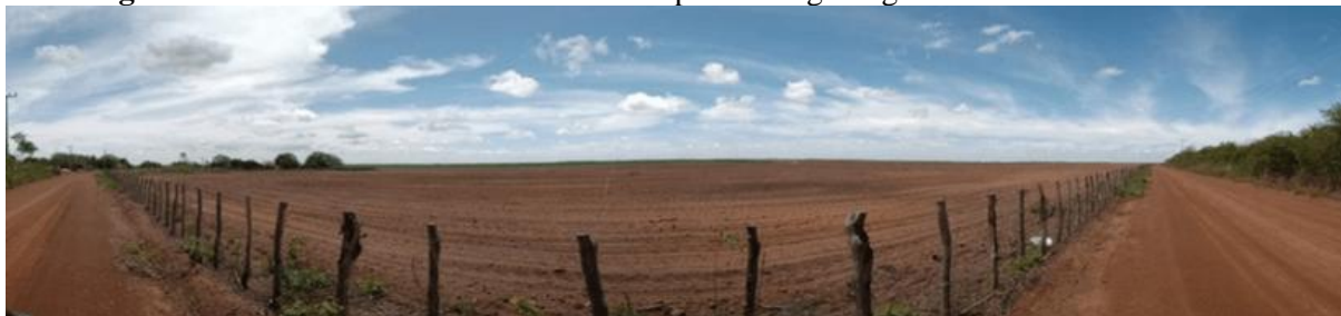
Figura 9 – Vista de uma das fazendas de empresa do agronegócio em Tabuleiro do Norte.