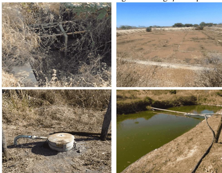
Figura 2 – Estruturas de armazenamento d'água e de irrigação do perímetro irrigado.

Este aspecto foi percebido mediante um agricultor local que nos guiou para a visita à diversas estruturas desativadas e em estado de deterioração, a exemplo das piscinas e canais de distribuição de água. Percebeu-se como os(as) camponeses(as), mesmo com a existência de estruturas construídas pelo Estado, mas inutilizadas em função de sua conservação, necessitam traçar estratégias para desenvolver as atividades econômicas que vão tornar possível a permanência no território, como a construção de estruturas como poços, piscina com material de geomembrana para armazenamento de água e sistema de irrigação por gotejamento. Na Figura 2, na sequência, é possível observar algumas das estruturas mencionadas.