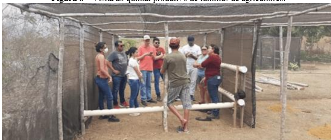
Figura 8 – Visita ao quintal produtivo de famílias de agricultores.

A última atividade deu-se no município de Tabuleiro do Norte, também localizado na região do Vale do Jaguaribe. O território em questão, que corresponde a uma parcela da Chapada do Apodi, vem enfrentando nos últimos anos os impactos decorrentes da territorialização do agronegócio, que tem produzido processos de injustiça ambiental (SOUSA, 2023). Nessa área foram visitadas três comunidades que sofrem com esses impactos, sendo elas: Santo Estevão, Santo Antônio dos Alves e Curral Velho. Na ocasião, realizou-se um grupo focal e diálogos com camponeses(as) e membros da Cáritas Diocesana de Limoeiro do Norte (Figura 8), organização que atua na defesa dos territórios camponeses e por justiça ambiental.