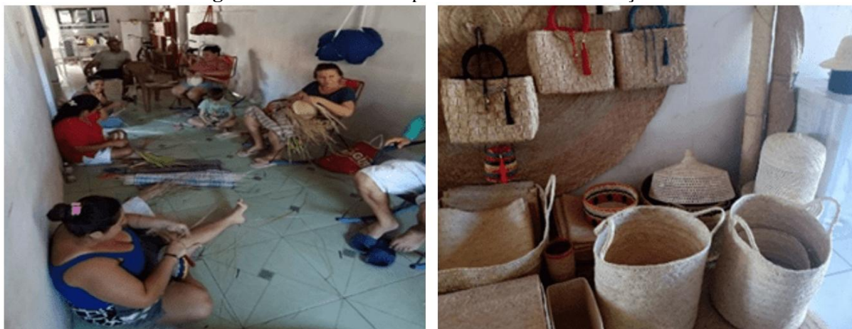
Figura 5 – Artesanato da palha de carnaúba em Itaíçaba.