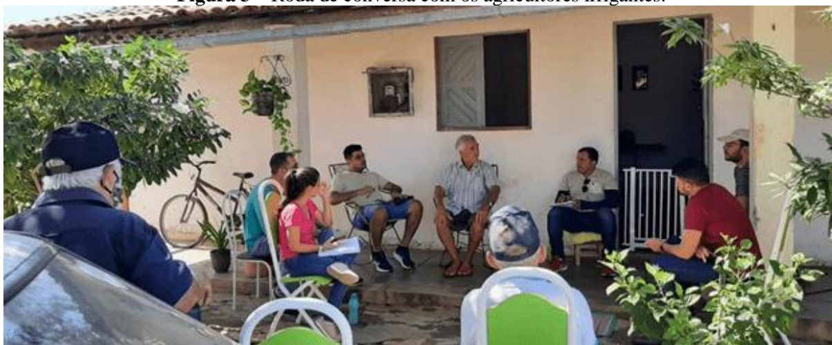
Figura 3 – Roda de conversa com os agricultores irrigantes.

Ademais, após esse itinerário para observação desses aspectos no Perímetro Irrigado Sabugi, participamos de uma roda de conversa (Figura 3) com os agricultores mais antigos da comunidade, chamados de colonos irrigantes. Nesse momento de diálogo, percebeu-se que as falas desses sujeitos são carregadas de lembranças a respeito do início da implantação do perímetro ao relatarem, principalmente, sobre a diversidade da produção que contava com culturas como banana, algodão, tomate, feijão, milho, mamão, melancia e outras. A partir desse grupo focal, percebeu-se como as falas dos sujeitos suscitam as lembranças do grupo participante, complementando as informações.