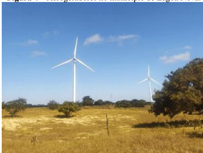
Figura 4 – Aerogeradores no município de Lagoa Nova.

Em decorrência da sua posição geográfica, o estado do Rio Grande do Norte dispõe de uma das maiores matrizes eólicas do Brasil (OLIVEIRA NETO, 2016), sendo o município de Lagoa Nova um dos locais selecionados para instalação de parques de geração de energia eólica. Posicionado na região da Serra de Santana, em 2014 iniciou-se o processo de implantação de aerogeradores (Figura 4) destinados à produção de energia eólica que, ao longo dos anos, alterou profundamente a paisagem do município provocando impactos sociais e ambientais.