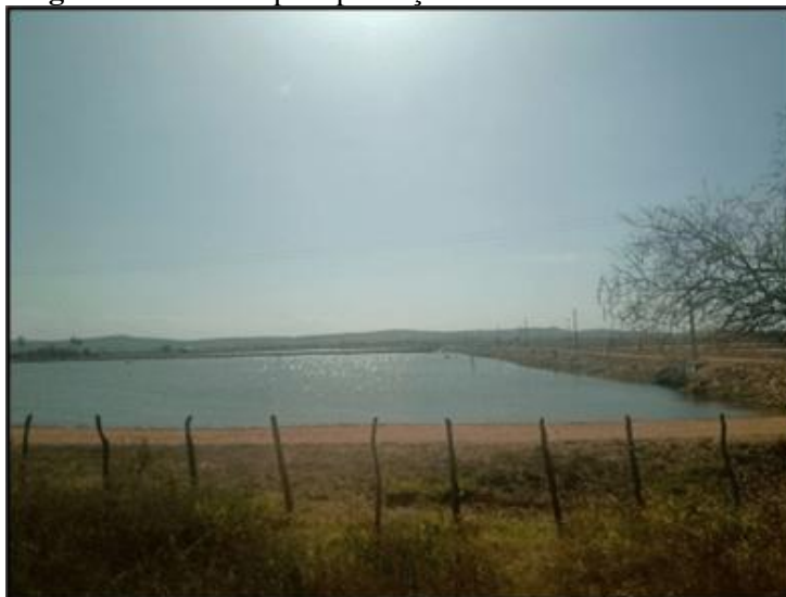
Figura 6 – Viveiro para produção de camarão em cativeiro.

precisam comprar a palha. Nesse cenário, elas mencionam que a criação de camarão em viveiros tem sido um dos principais vilões do seu trabalho.