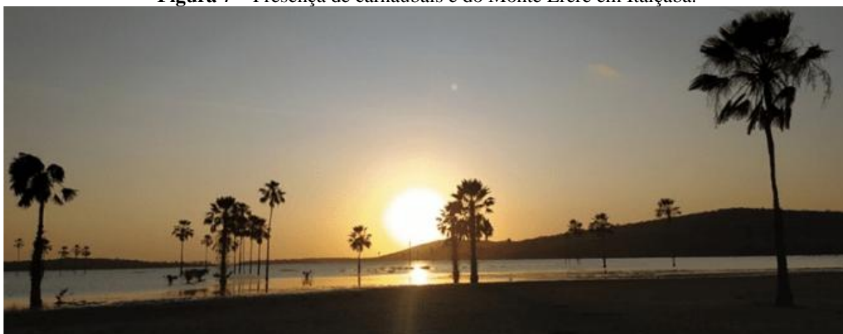
Figura 7 – Presença de carnaubais e do Monte Eréré em Itaíçaba.

Ainda em Itaíçaba, foi possível dialogar sobre a presença indígena no município, a partir de sua vinculação com o artesanato da palha de carnaúba. Autores como Ferreira Neto (2011) e Vicente (2011) retratam um massacre da etnia Paiacu que ocorreu em 1699, durante a Guerra dos Bárbaros, em um local chamado Monte Eréré (atualmente um dos principais cartões postais de Itaíçaba) (Figura 7), onde os indígenas desta etnia estavam aldeados e um comandante teria ordenado que os prendessem e matassem.