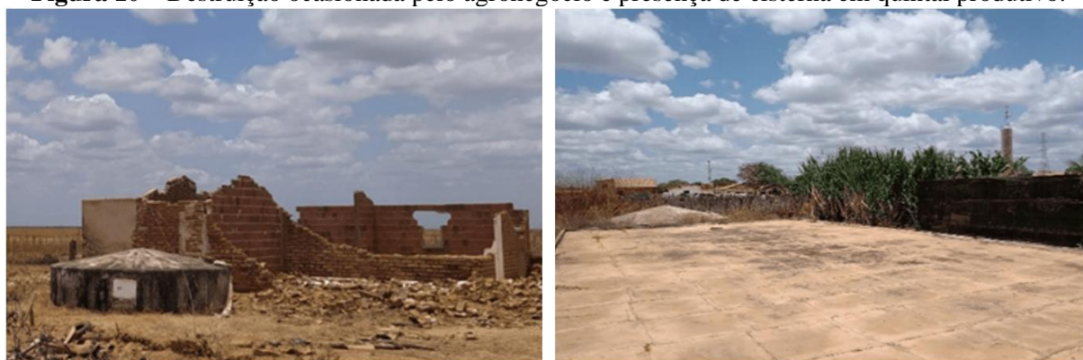
Figura 10 – Destruição ocasionada pelo agronegócio e presença de cisterna em quintal produtivo.

Esses dois modelos são impossíveis de coexistirem de maneira harmônica em um mesmo território. O agronegócio, a partir de sua territorialização (compra e arrendamento de terras), da utilização intensivo-dependente de agrotóxicos e da monocultura, impossibilita a convivência com o Semiárido. Sobre os territórios camponeses, como mostra Sousa (2023), a injustiça ambiental produzida pelo agronegócio se revela mediante a destruição de tecnologias sociais (Figura 10), da expulsão de camponeses(as), contaminação do ar, desmatamento, desativação de apiários em função do contato com os agrotóxicos e do acirramento da negação do direito de acesso à água.