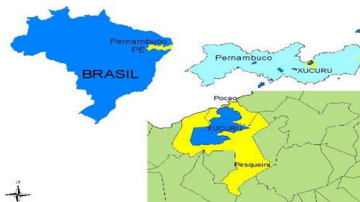
Figura 2 Mapa de Pernambuco localização da Comunidade Xukuru