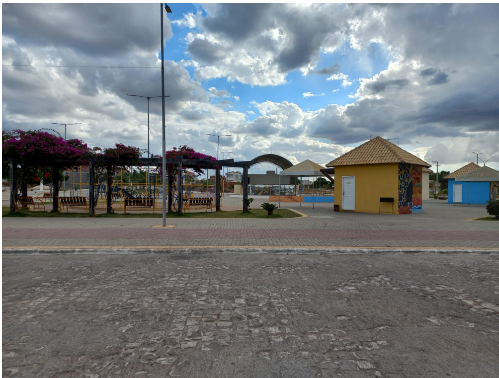
Figura 04 – Praça de Eventos Integração Portalegre

Ao observar essa evolução e grande desenvolvimento que tem acontecido nessa área estudada, podemos levar em consideração fatores importantes que podem ter influenciado os atuais moradores a procurarem esse espaço para construir seus comércios e suas habitações, como por exemplo, a atual praça de eventos intitulada Integração Serrana (Figura 04).