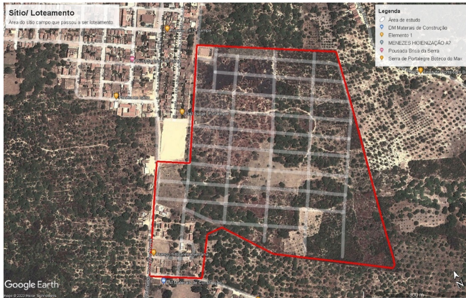
Figura 05 – Portalegre (RN): área no início da implantação do loteamento - 2012

evidente que a praça de eventos teve um papel significativo na expansão e no progresso urbano da cidade. Nas figuras 05, 06 e 07, podemos ver a progressão e o desenvolvimento que ocorreu nesta região desde a criação do loteamento até o presente.