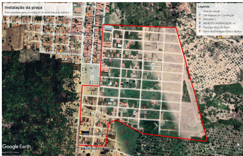
Figura 06 – Portalegre (RN): área após a instalação da Praça de Eventos (Integração Serrana) – 2020