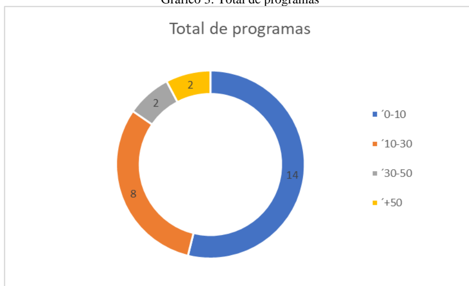
Gráfico 3: Total de programas

O total de programas disponibilizados vai ao encontro dos dados anteriores. Considerando a facilidade na produção e a dificuldade na manutenção de uma agenda de trabalho, temos que mais de 50% dos podcast possuem menos de 10 programas.