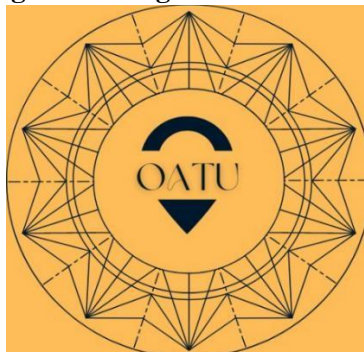
Figura 1 – Logomarca do OATU