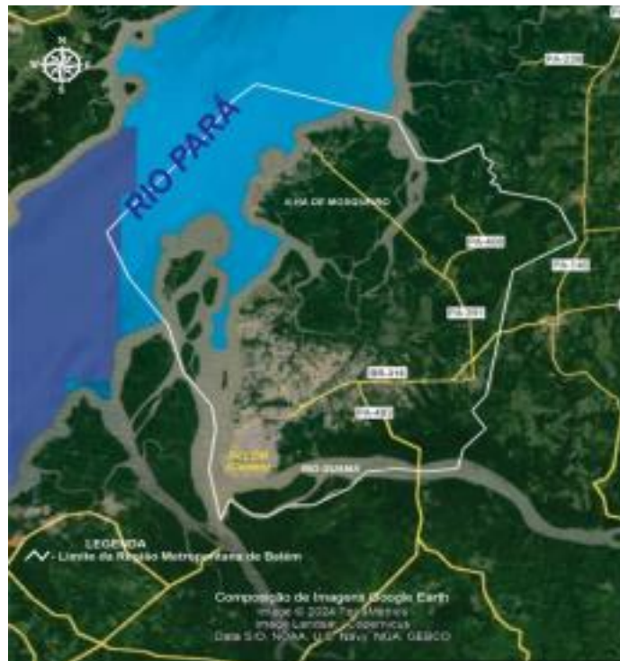
Figura 3- Imagem da Região Metropolitana de Belém do Pará.