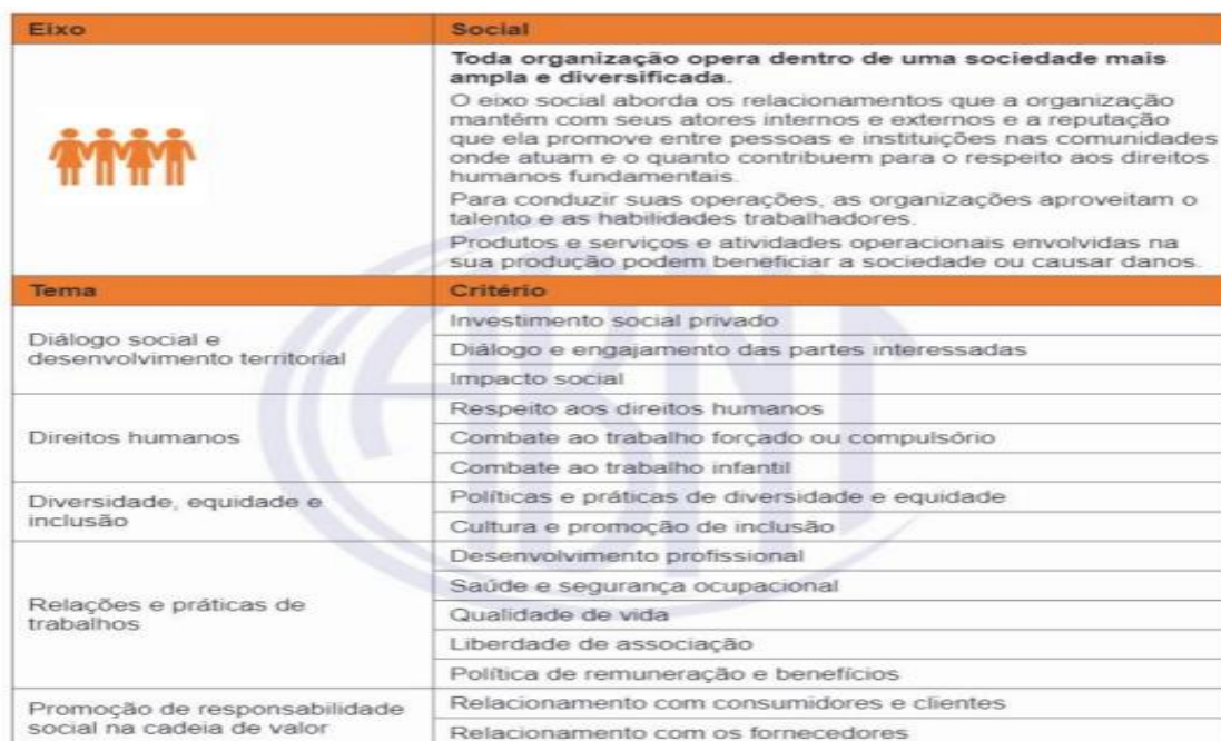
Quadro 2: Diretrizes do eixo social, 2022.

O Quadro 2 elenca as diretrizes do eixo social com base para ABNT PR 2030 (2022):