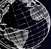
Figura 1: 17 ODS (objetivos de desenvolvimento sustentável).